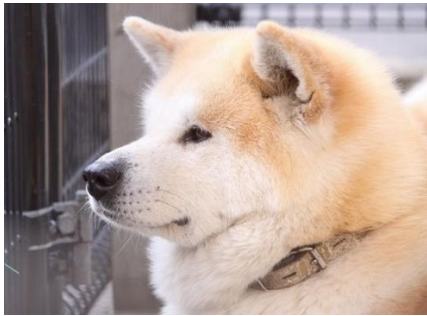
大館の隣町=鷹巣から