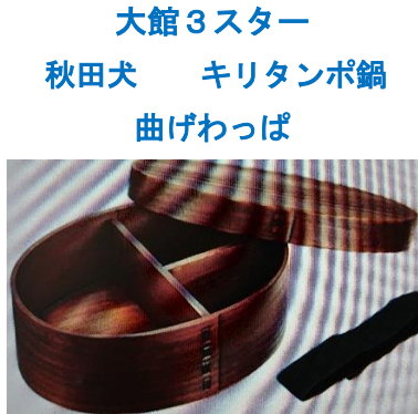
大館3スター 秋田犬 キリタンポ鍋 曲げわっぱ